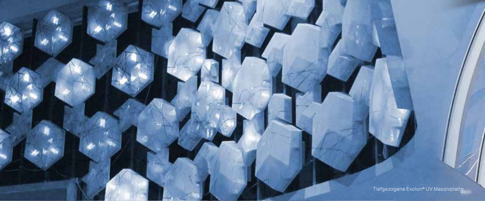
Tiefgezogene Exolon® UV Massivplatte